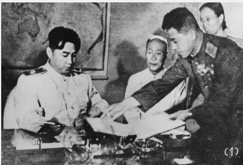
El patriota Kim Il Sung en la firma del armisticio, el 27 de julio de 1953 en la localidad de Panmunjom

La intención de los Estados Unidos fue siempre volver a la guerra para desaparecer la RPDC. Por eso nunca aceptó firmar la paz definitiva, sino sólo un armisticio el 27 de julio de 1953. La decisión de la RPDC de desarrollar su armamento nuclear disuasivo , sacrificando bienestar y desarrollo social, es lo que ha impedido que Estados Unidos desate otra guerra de conquista.