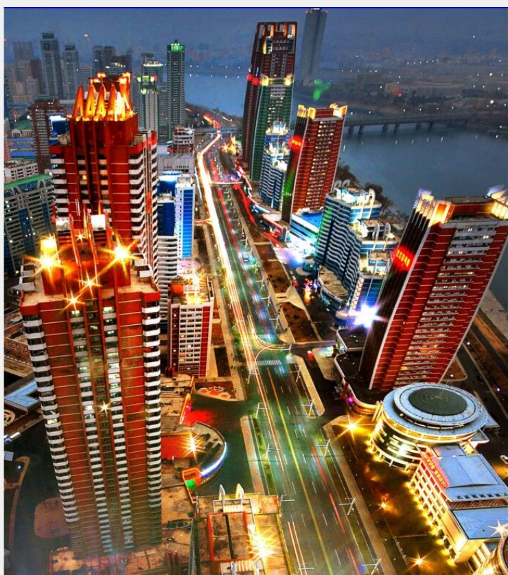
Espectacular vista nocturna de Pyongyang, capital de la República Popular Democrática de Corea.

A pesar de la resistencia armada del pueblo coreano la dominación japonesa se mantuvo hasta 1945. La violencia de los japoneses contra el pueblo y las mujeres coreanas es vergonzosa, reprochable y criminal. Al terminar la Segunda Guerra Mundial y habiéndose rendido Japón, los Estados Unidos impusieron la división de naciones y familias a partir del Paralelo 38. En 1946 se inició la reconstrucción del país con un Comité Popular Provisional. Entonces (en el Norte) se nacionalizaron los bancos, se estableció la jornada de ocho horas, se reconstruyeron las fábricas y las minas y se impulsó la agricultura. Se expropió la tierra a latifundistas para repartirla entre los campesinos, se nacionalizaron el transporte, los ferrocarriles y las empresas industriales. Los derechos de hombres y mujeres se igualaron y se echó a andar la seguridad social y el servicio médico gratuito. El 9 de septiembre de 1948 al fundarse la República Popular Democrática de Corea, la Asamblea Suprema del Pueblo, de la mano del gran dirigente Kim Il Sung aprobó la Constitución y pidió tanto a la URSS como a Estados Unidos que retiraran sus tropas y dejaran al pueblo coreano elegir libremente su camino. A finales de 1948 las tropas soviéticas se retiraron. ¿Qué hizo Estados Unidos? Desató la guerra Pasa a pag. 2