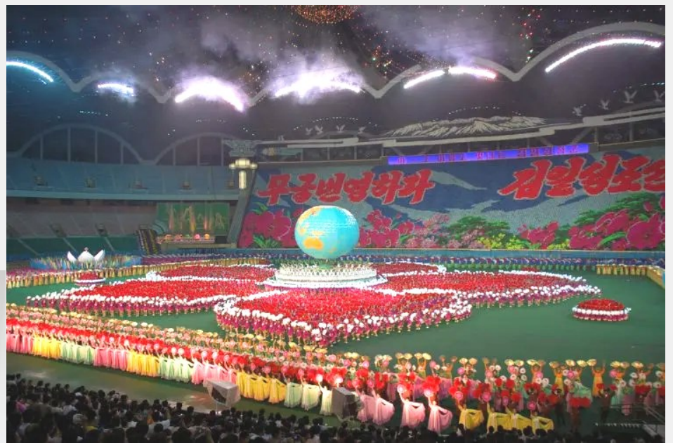
El estadio Rungrado o Primero de Mayo en Pyongyang en la República Popular Democrática de Corea es sin duda el estadio más grande del mundo con 150 mil butacas. Está inspirado en la magnolia, flor nacional de la República.

En esa ruta se explica que la Francia sumisa de Macron a pesar de la victoria del pueblo, decidiera colocar a un conservador sin nivel al frente del gobierno y por eso desesperadamente el gobierno yanqui debilitado dentro y fuera de sus fronteras apoya a un dictador asesino como Netanyahu o a un sedicente libertario que en Buenos Aires rocía con gas pimienta a los jubilados que se oponen a la reedición de la dictadura violenta, ahora en manos de Javier Milei.