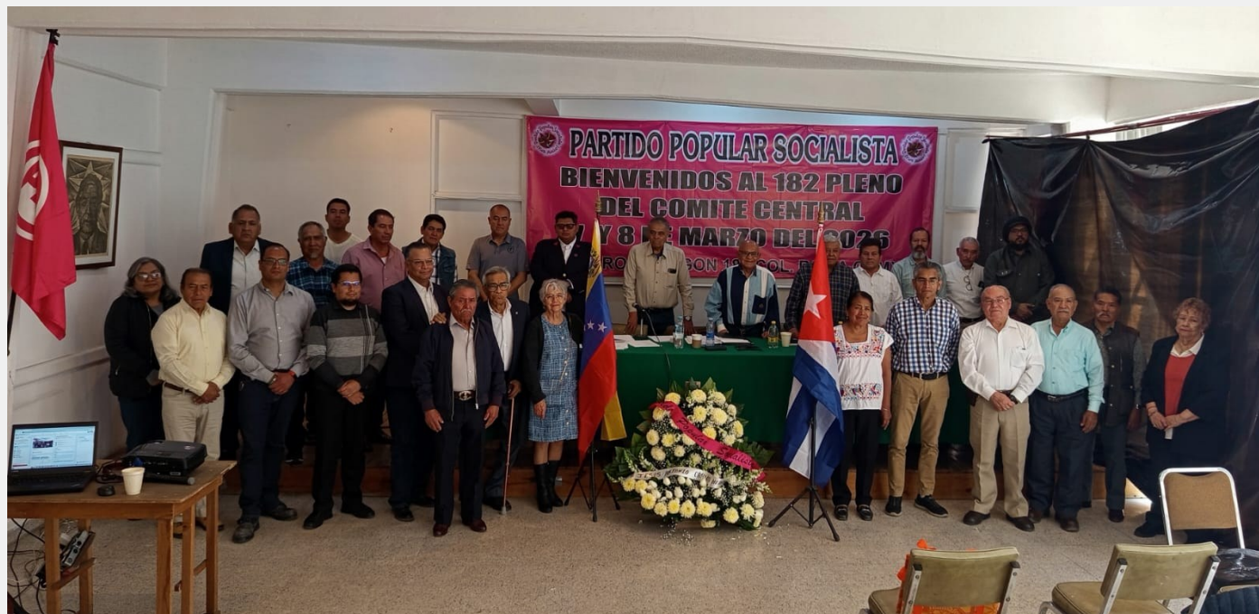
ESCENA DEL 182 PLENO DEL COMITÉ CENTRAL EN EL “SALVADOR ALLENDE”

Sala de Sesiones Presidente “Salvador Allende”, del PPS a los ocho días del mes de marzo de dos mil veinte y seis.