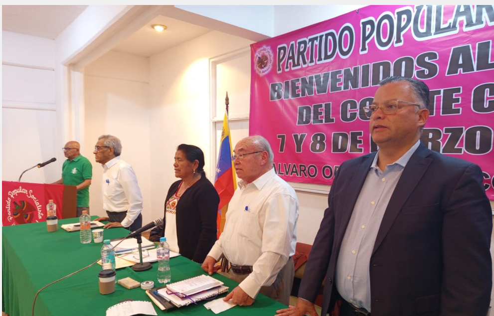
VISTA PARCIAL DEL PRESIDUM DE LA DIRECCIÓN NACIONAL DEL PARTIDO POPULAR SOCIALISTA EN EL 182 PLENO DEL CC