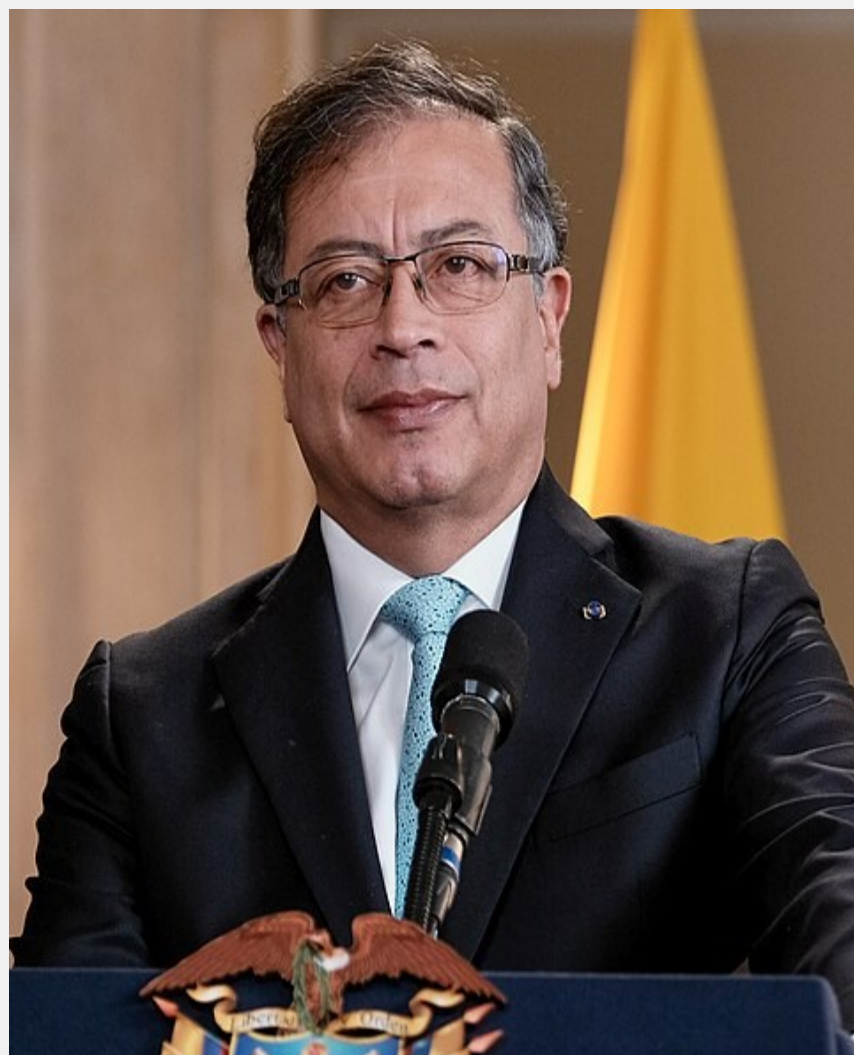
Gustavo Petro Urrego; Presidente de Colombia

Vamos por partes. Después de que Gustavo Petro fuera a Nueva York, que pronunciara brillantes discursos en la ONU y que calculadamente acudiera a una manifestación a favor de Palestina en septiembre de 2025, el propio insuflado Marco Rubio personalmente ordenó retirar la visa diplomática al Presidente Petro. No sabía en la que se metía. Además le expresó a Petro una torpeza más de las que acostumbra: “no puedes morder la mano que te alimenta y esperar seguir siendo bienvenido en nuestra casa”. “¿Morder la mano que te alimenta”? ¿En que piensa el Secretario de Estado? Es evidente que por su cabeza no pasa la realidad de que su gobierno y las empresas imperialistas meten la mano en los países de América Latina para saquearnos y que quienes alimentamos al monstruo imperialista so-