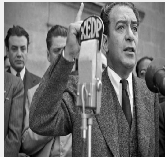
Vicente Lombardo Toledano, profundo estudioso de la Revolución Mexicana y fundador del PPS.

Hoy, 20 de noviembre de 2025, se cumplen 115 años del estallido del movimiento armado que tuvo como objetivo eliminar el gobierno dictatorial de Porfirio Díaz, destruir la estructura feudal y semi-esclavista e implantar profundas reformas en el aspecto económico y político que se sintetizaban en los lemas “Tierra y Libertad” y “Sufragio Efectivo. No reelección”