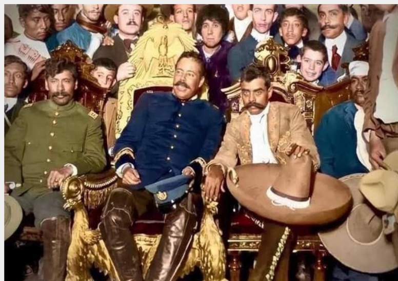
Francisco Villa y Emiliano Zapata en Palacio Nacional. Aparecen además de los próceres, Otilio Montaño (vendado en la cabeza); Rodolfo Fierro (de pie, atrás de Otilio Montaño) y Tomás Urbina (sentado a la derecha de Villa). También se ve a la gran activista Dolores Jiménez y Muro, quien aparece entre Villa y Zapata.

Hubo corrientes que al ver cómo avanzaba y se profundizaba la Revolución Mexicana se opusieron a ella y la combatieron, como los grandes terratenientes, algunos empresarios y sobre todo el gobierno imperialista de los Estados Unidos que pre-