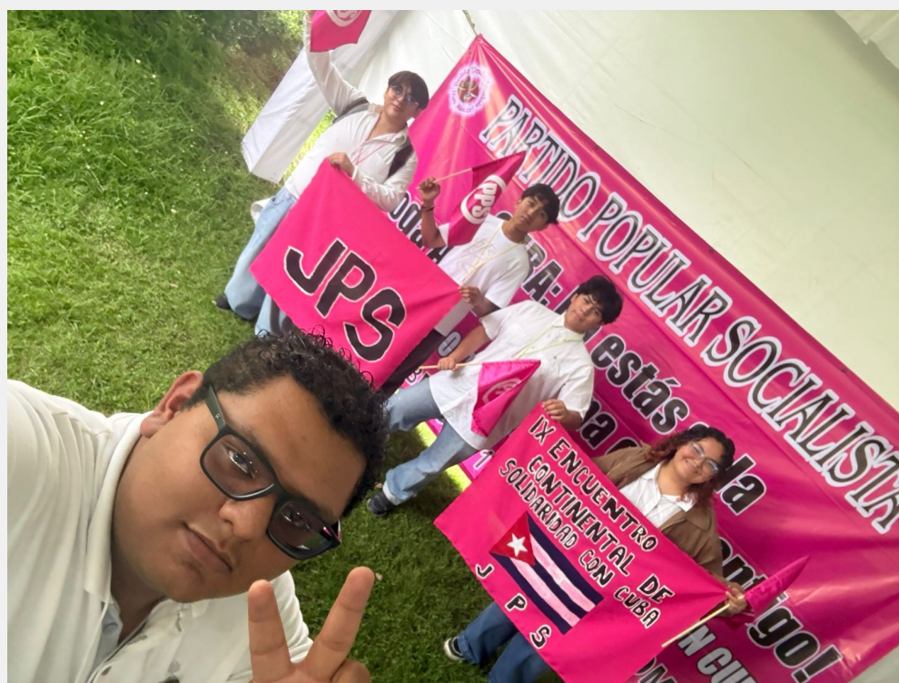
Destacamento de la gloriosa Juventud Popular Socialista en el IX Encuentro Continental de Solidaridad con Cuba en Las Pinas