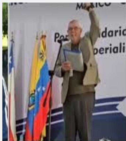
El Excelentísimo Embajador de Cuba en México señor Marcos Rodríguez Costa en la clausura del IX Encuentro Continental de Solidaridad.

El PPS expresó en el número 35 de Trinchera Lombardista , distribuido en el evento a todos, nuestros argumentos. No fueron tomados para la relatoría. Ahora sintetizamos que Cuba no es caso aislado. La tragedia que vive Cuba tiene una estrecha relación con toda América Latina, el Caribe y el mundo de los países débiles. Todos los países del área tenemos un pasado común y todavía padecemos supervivencias semi-feudales. Tenemos una historia similar de luchas por la independencia, por el progreso económico y por alcanzar una vida democrática.