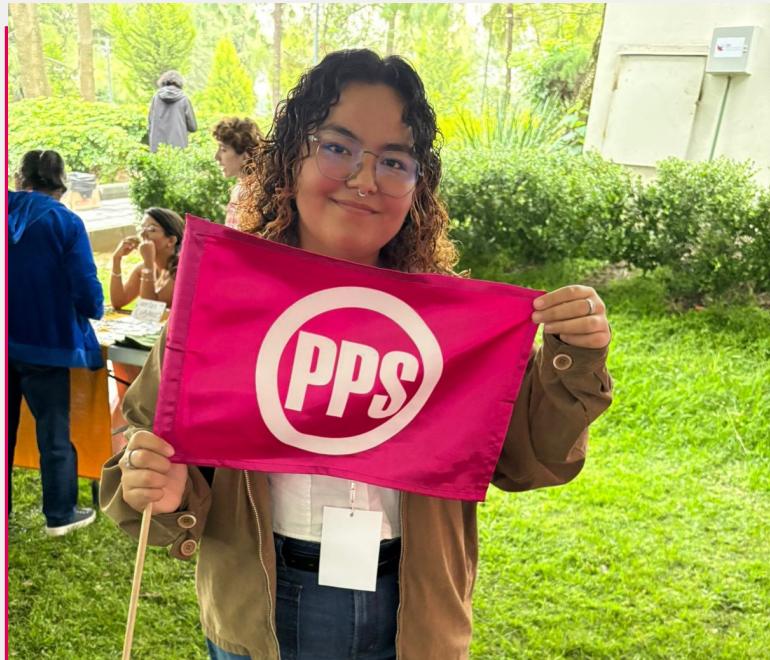
La Juventud Popular Socialista en el IX Encuentro