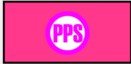
Delegados del Partido Popular Socialista al finalizar el IX Encuentro Continental de Solidaridad con Cuba en Las Pinas los días 9,10,11 y 12 de octubre