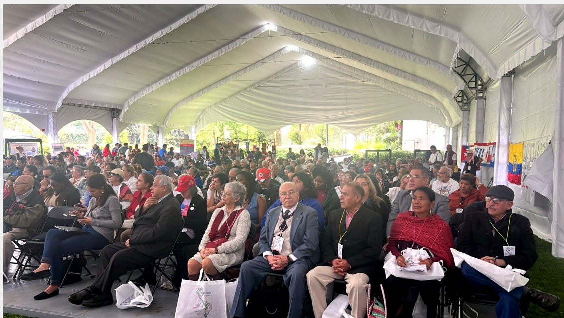
Al frente, militantes del Partido Popular Socialista en una de las sesiones del IX Encuentro Continental de Solidaridad con Cuba en Los Pinos

El imperialismo en América Latina se apoderó de territorios. Nos robó el hierro, el cobre, el zinc, el petróleo, el aluminio, el oro y la plata, el tabaco, el café, el azúcar, los bosques y maderas, el algodón, la producción agrícola y ganadera, el producto de las