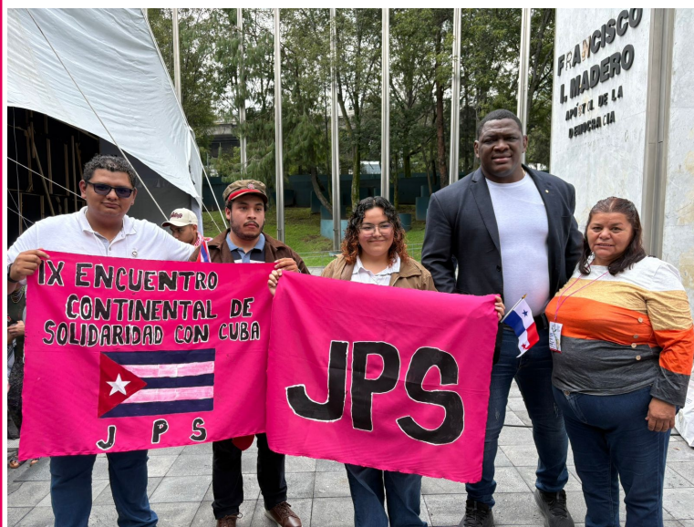
Militantes de la Juventud Popular Socialista con el gran pentacampeón Mijaín López en Las Pinas el 10 de octubre