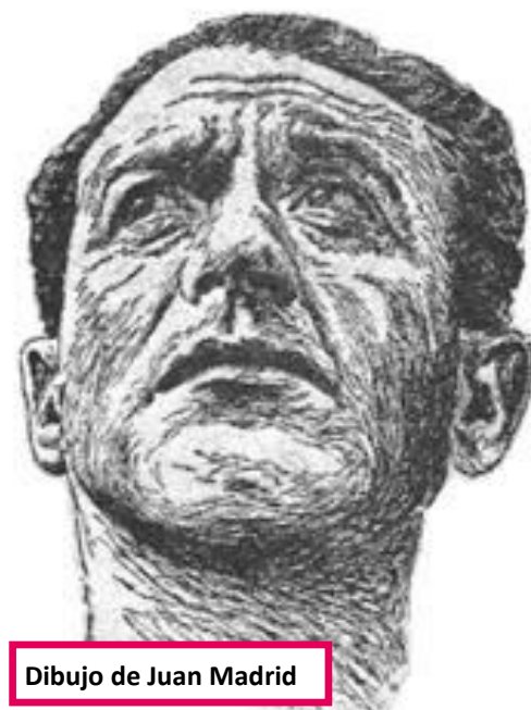
Dibujo de Juan Madrid

Al margen de que en el pasado, el gobierno y los colonos criminales yanquis nos arrebataron por la fuerza de las bayonetas más de la mitad de nuestro territorio, (asunto que los jóvenes mexicanos no deben olvidar jamás ), en la página 13 del documento editado por el Partido Popular Socialista en 1987 se lee que "En 1880 comienza una etapa decisiva para el porvenir de nuestra nación. Es la lucha del imperialismo, que aparece en nuestro (pasa a la pag. 2)