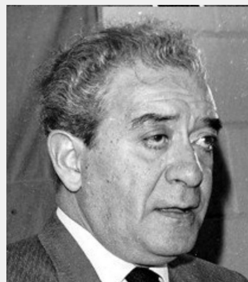
Maestro Vicente Lombardo Toledano

3 AMÉRICA LATINA: En la región existen dos grandes tendencias políticas: un movimiento progresista que se opone a la dominación hegemónica estadounidense, con Claudia Sheinbaum en México, con Bernardo Arévalo en Guatemala, con Xiomara Castro en Honduras, en Nicaragua con Daniel Ortega, en Cuba con Miguel Díaz-Canel; en Colombia con Gustavo Petro, en Venezuela con Nicolás Maduro, en Brasil con Lula Da Silva , en Bolivia con Luis Arce y en Chile con Gabriel Boric, además de Yamandú Orsi en Uruguay. La otra tendencia es la pro-imperialista que obedece a EU., como Bukele o Noboa.