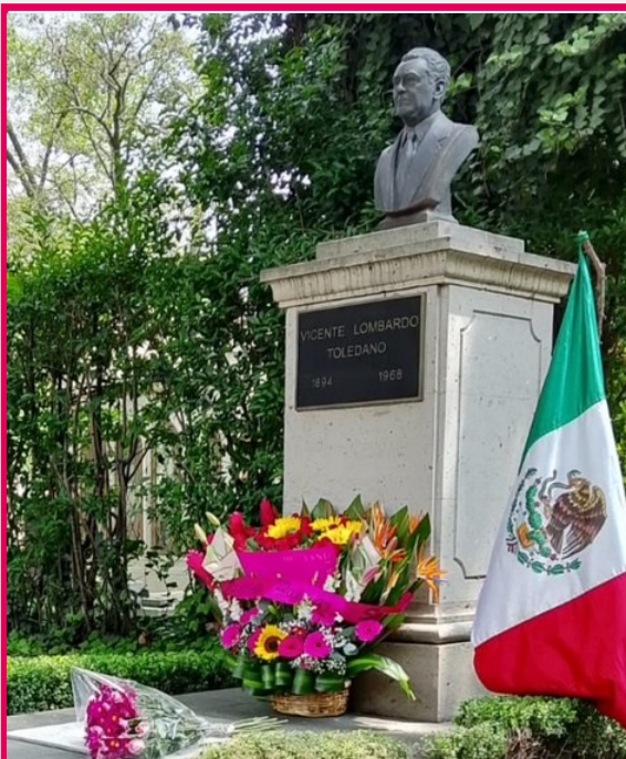
16 de julio de 2025 en la Rotonda, CDMX.