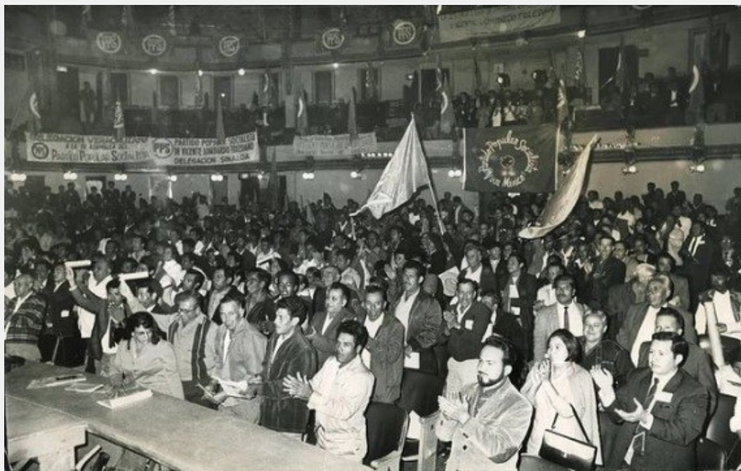
Alguna asamblea del Partido Popular Socialista. 1960.

Es fácil apreciar que el materialismo dialéctico es una filosofía opuesta al agnosticismo, al idealismo, al materialismo mecanicista, al irracionalismo, a la filosofía de la vida, al existencialismo, al pragmatismo y al fascismo.